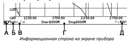
Информационная строка на экране прибора

На экран прибора выводятся результаты сканирования частотного задания в виде установленных пользователем графиков и диаграмм. Текущие настройки прибора, диапазон сканирования, тип выводимого графика или диаграммы и другая важная для пользователя информация расположена на нижней строке экрана. Рассмотрим эту информационную строку слева направо.