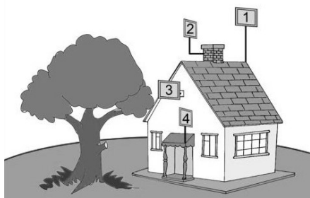
Рисунок 1 – Варианты установки антенны

3.2. На пути от антенны до базовой станции не должно быть никаких близко стоящих высоких препятствий (здания, горы, холмы, лесопосадки и т.п.) мешающих распространению сигнала. Поэтому устанавливайте антенну как можно выше.